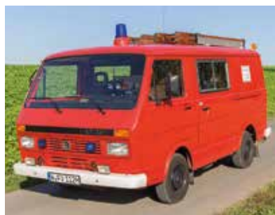
Dritter Halt: Ostwestfalen-Lippe