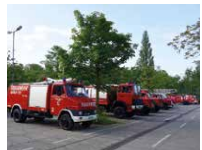
Teilnehmerrekord: 75 Fahrzeuge